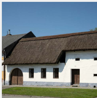
Gajovo | 14

Na okraji návsi vás přivítá čp. 6 „Klimečkovo“ , obydlí venkovského řemeslníka a drobného zemědělce z konce 18. století. Obydlí sloužilo i jako dílna jednoho z majitelů, který zde provozoval sedlářské řemeslo. V dílně se vyráběly koňské i kravské postroje a chomouty. Je to nejmenší dochovaná tradiční stavba v obci.