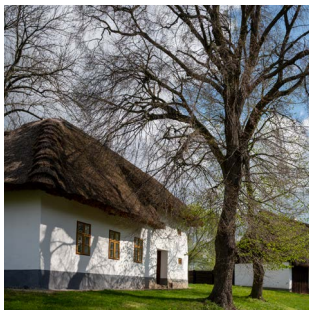
u Symerských | 65

Poblíž Hejnice se nachází objekt čp. 104 , který v minulosti sloužil jako panská kovárna, a to ještě koncem 18. století. V současnosti poskytuje zázemí muzejním pracovníkům.