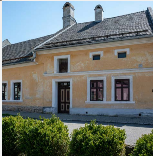
Klimečkovo | 6